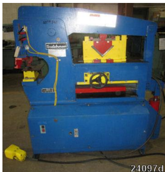
" Ironworker "

Comprar: Nueva o usada, marca de referencia, capacidad, y muy importante, especificar el material, y las dimensiones del mismo.